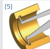
[5] Ball Ø 1,0 mm Ball Ø 1,5 mm Ball Ø 2,0 mm