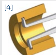
[4] Ball Ø 1,0 mm